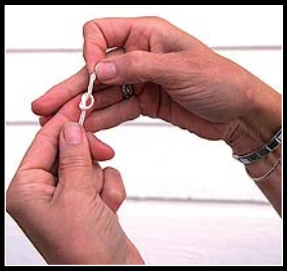
6. Haga el nudo.