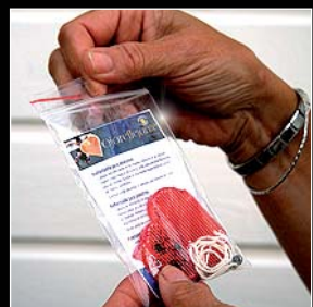
1. Abre la bolsita.