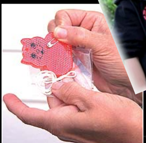
3. La bolsita contiene piezas pequeñas: Un reflectante, imperdible y hilo.