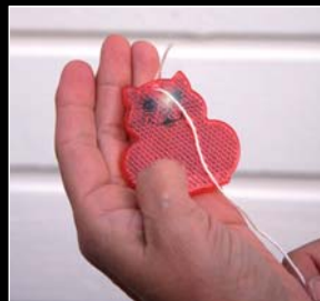
4. Coloque el hilo para reflectante.