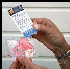
2. Lea las instrucciones.