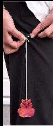
9-10. En el día, deja el reflectante en el fondo de bolsillo.