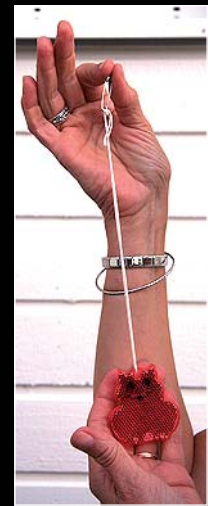
7-8. Ahora, engancha el imperdible dentro del bolsillo lateral de los pantalones o en los laterales de ropa. Deja colgado el reflectante con su hilo para que se mueva libremente.